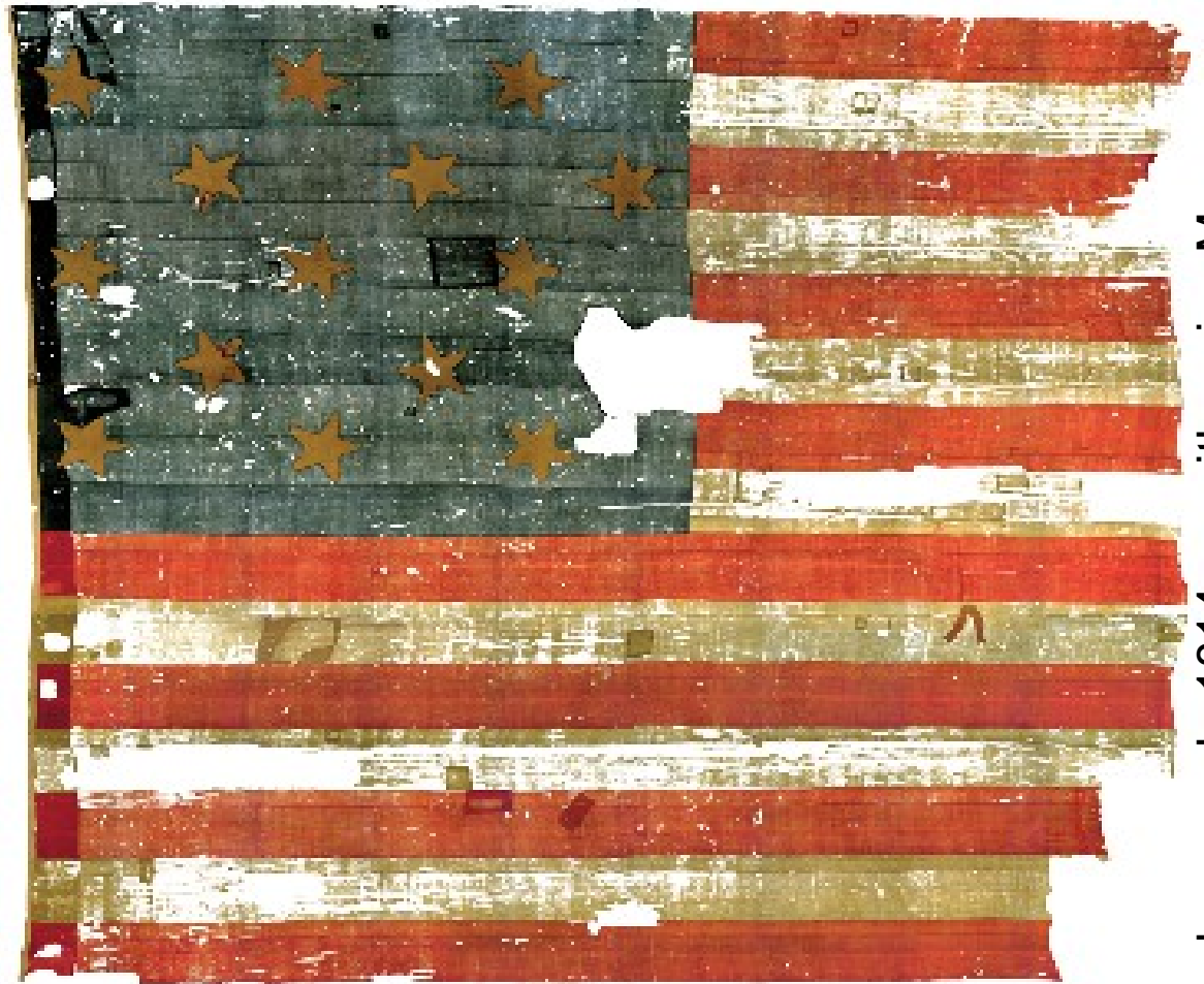
drapeau de 1814 – smithsonian Museum

Les démocraties Régimes, histoire, exigences ( extraits )