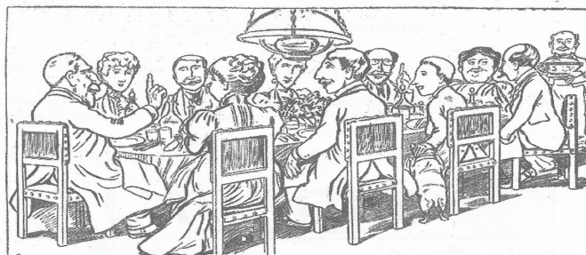
Document 2 : caricature de Caran d'Ache, parue dans le Figaro le 14 février 1898 UN DINER EN FAMILLE

... Surtout ! ne parlons pas de l'affaire Dreyfus !